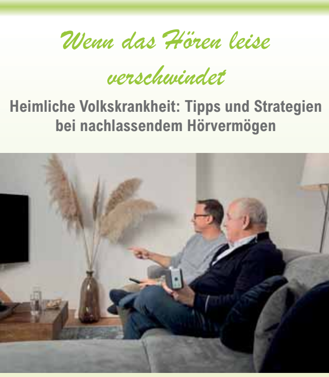
Ein nachlassendes Hörvermögen schränkt den Alltag beispielsweise beim Fernsehschauen spürbar ein.

(DJD). Der Verlust des Hörvermögens beginnt oft schleichend und bleibt lange unbemerkt. Die sogenannte Altersschwerhörigkeit, die häufig ab dem 50. Lebensjahr einsetzt, wird von vielen Betroffenen zunächst als Ermüdungserscheinung abgetan. Dabei handelt es sich um eine häufig unterschätzte Volkskrankheit. Laut der aktuellen EuroTrak-Studie 2025 geben rund 12,6 Prozent, also etwa jede achte erwachsene Person an, mit einer Hörminderung zu leben. Gleichzeitig verzichtet fast jeder fünfte Betroffene, etwa 18 Prozent, trotz dieser Selbsterkenntnis auf eine professionelle ärztliche Diagnose oder eine entsprechende Therapie. Ratgeber Tipps und Tests rund ums Hörvermögen Wenn das Gehör nachlässt, führt dies nicht selten zu einem sozialen Rückzug und einer Minderung der Lebensqualität. Um dieser Entwicklung entgegenzuwirken, bieten moderne Informationsplattformen einen umfassenden Überblick über Präventions- und Hilfsmöglichkeiten. Für alle, die eine erste Einschätzung ihres Hörvermö-