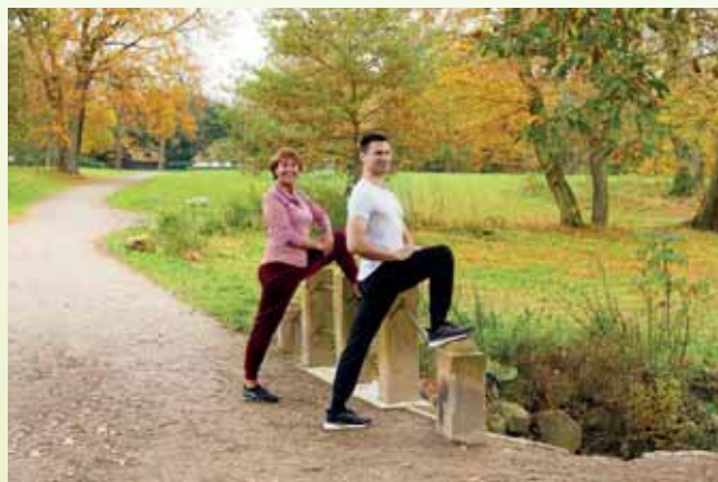
Bewegung fördert die Versorgung der Gelenkknorpel. Der Experte empfiehlt 3.500 Schritte am Tag und regelmäßige Übungen.

Mit Bewegung und der richtigen Ernährung die Gelenkgesundheit fördern